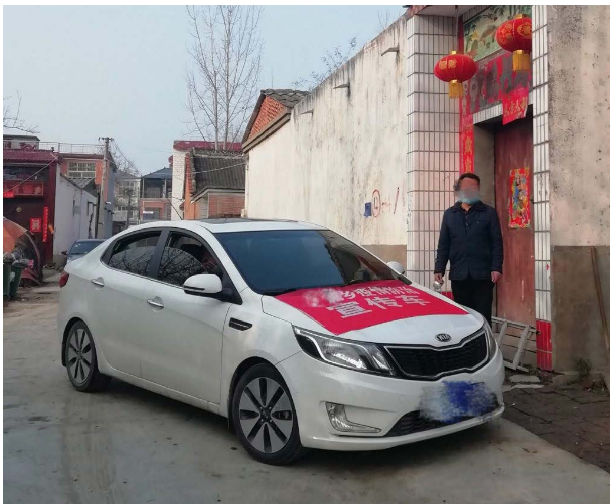
图 2：中国村庄内的巡逻车（图片非本研究点所摄）。

村干部和当地志愿者为村民集中购买食物和其他生活必需品。例如，某村庄村委会成立了一个微信群，供村民从当地商店下订单。在店主和志愿者紧密合作下订购的食物和其他生活必需品实现了无接触配送。当商店无法供应村民订购的商品时，村委会安排每天一次在最近乡镇市场进行集中采购。我们另外的研究样本村庄也采取了类似服务方式，因此村民足不出户便能获得生活必需品。